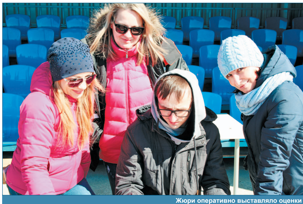
Жюри оперативно выставляло оценки

В УМиТ-7 СМТ-1 прошёл очередной конкурс профессионального мастерства среди водителей и слесарей по ремонту автомобилей. Обычно человеку, наверное, сложно представить, какой изящной может быть большегрузная техника под управлением опытного водителя. И что на КАМАЗе можно проехать по кругу, выполнить «змейку», припарковаться в стеснённых условиях, да ещё и задним ходом.