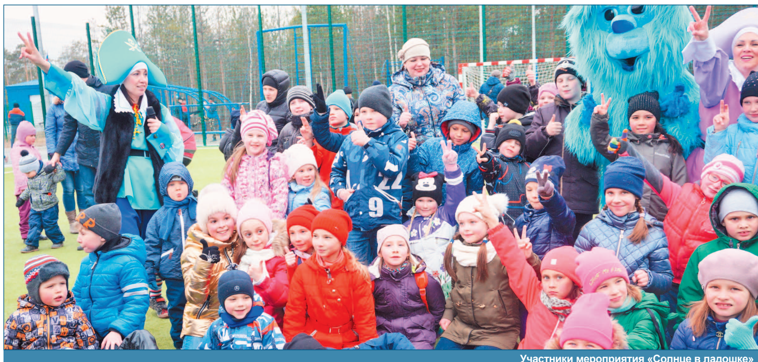
Участники мероприятия «Солнце в ладошке»

Организаторы красочного мероприятия старались создать праздничную атмосферу, благодаря сказочным персонажам, весёлой музыке и звонкому детскому смеху им это удалось. Родители не остались в стороне, они были вовлечены в забавные конкурсы и шуточные состязания.