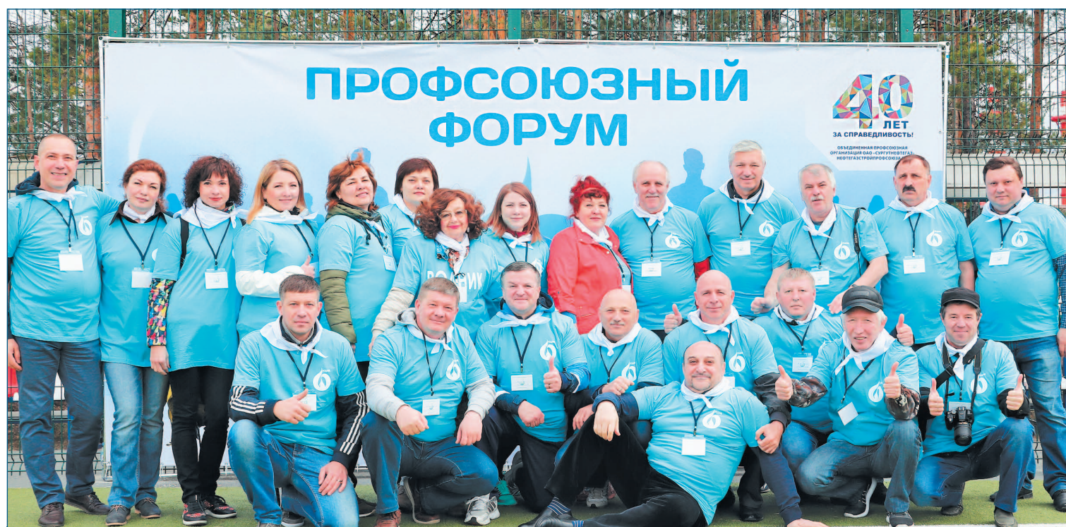
Председатели первичных профсоюзных организаций

Елена ПЕРВУХИНА